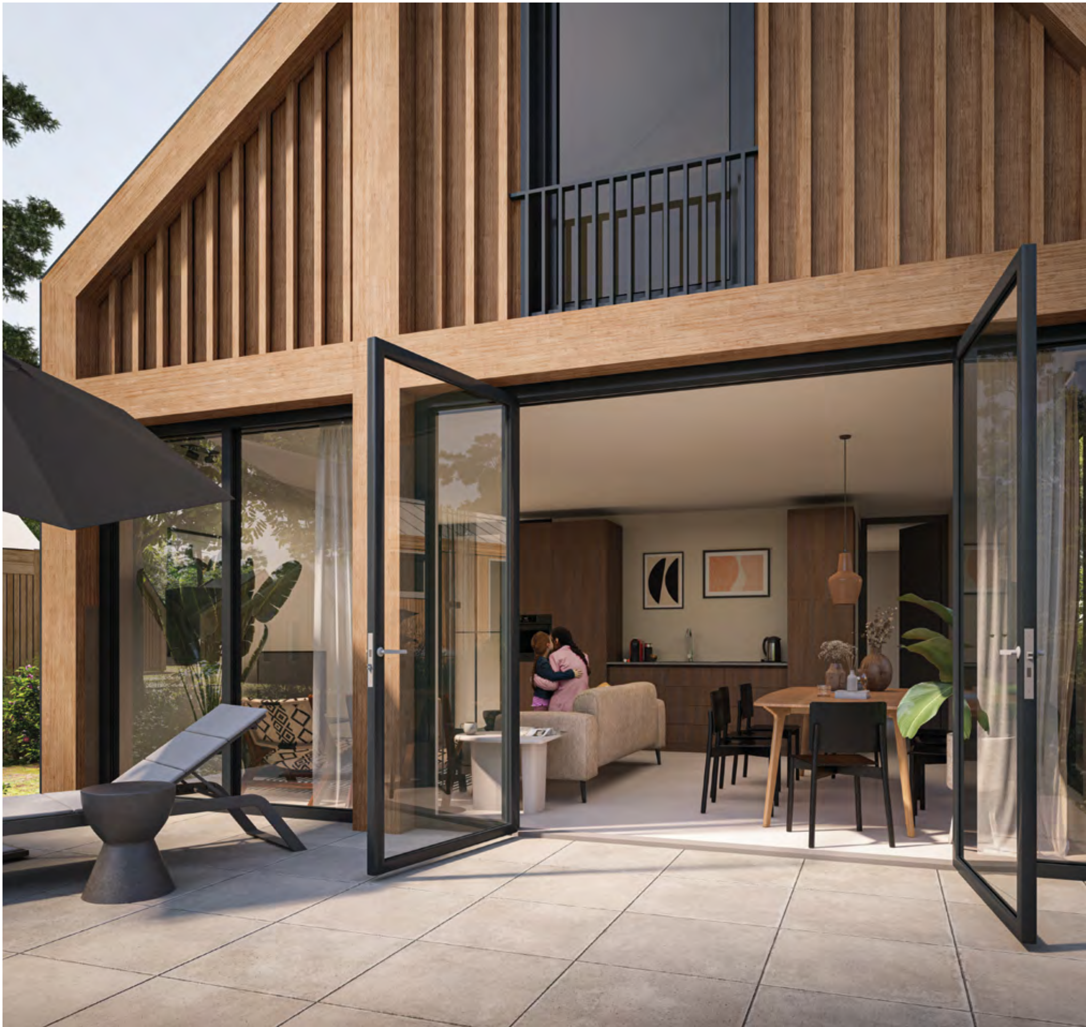
De Rieverst - Holiday Retreat